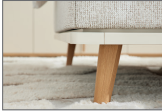
Füße und Holzrahmen massiv lackiert, Farbe sandfarbig