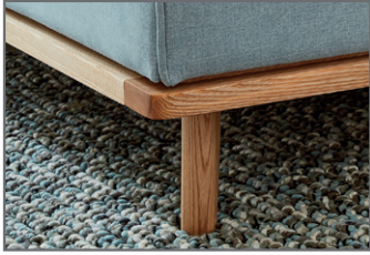
Füße und Holzrahmen massiv, eichefarbig