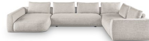
WK 595 MOLINA

Zugegeben: Wir sind anspruchsvoll. Unsere Produkte sollen sich in besonderer Weise durch Qualität, Ausdruckskraft und Komfort auszeichnen. Deshalb haben wir sechs Polstergarnituren entwickelt, deren Design höchsten internationalen Maßstäben gerecht wird und auf den Punkt bringt, wofür WK WOHNEN als Premiummarke bekannt ist: Geradlinigkeit, Großzügigkeit und Klasse.