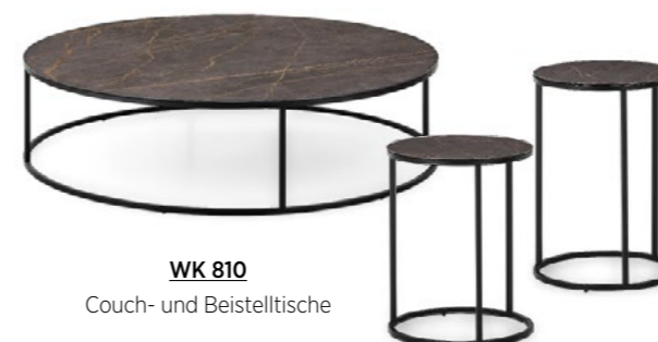
WK 810 Couch- und Beistelltische

Unsere Garnitur WK 591 TOLEDO besticht durch einen geradlinigen Look, bietet mit den leicht nach außen geknickten Armlehnen aber auch eine reizvolle Abweichung von geraden Linien und rechten Winkeln. Alternativ dazu ist auch eine konsequent kubische Variante erhältlich – lassen Sie einfach Ihren Geschmack entscheiden. Die großzügigen Sitzflächen und hochwertigen Bezüge in Stoff oder Leder machen auch dieses Modell zu einer Oase der Gemütlichkeit.