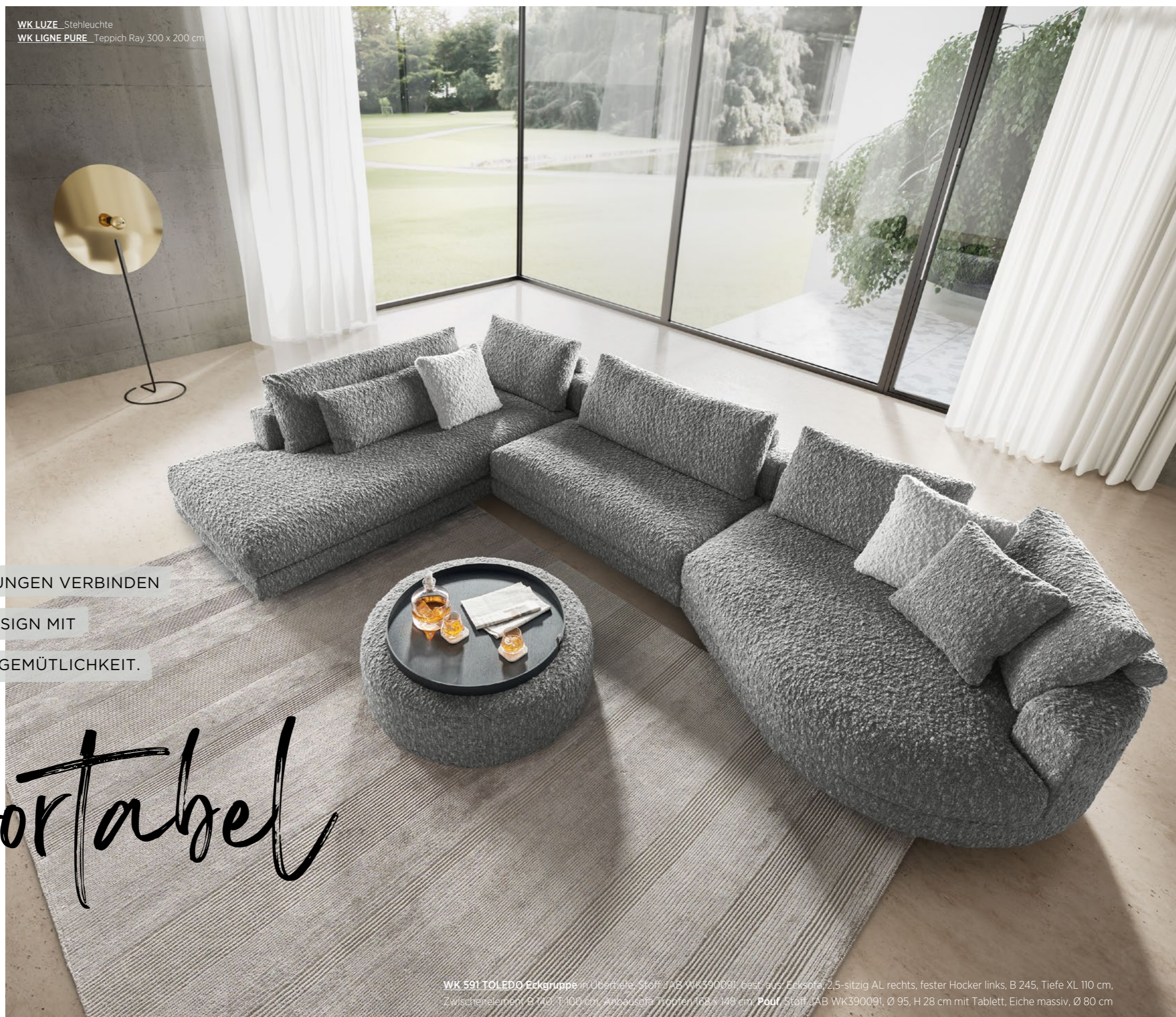
WK LUZE Stehleuchte WK LIGNE PURE Teppich Ray 300 x 200 cm