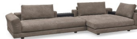
WK 591 TOLEDO