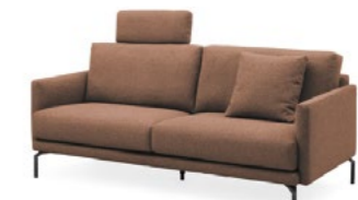
WK 593 GÖTEBORG