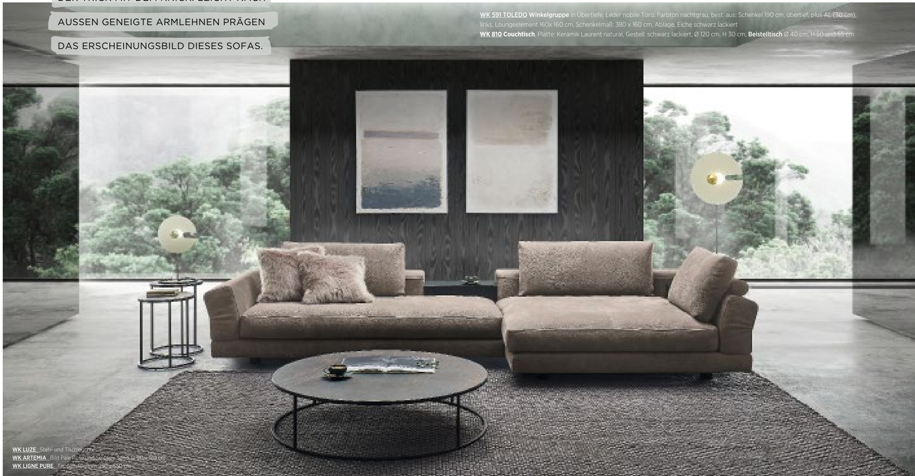
WK LUZE Steh- und Tischleuchte WK ARTEMIA Bild Pale Rose und Smokey Sand, je 90 x 120 cm WK LIGNE PURE Teppich Rhythm 250 x 350 cm

WK 810 Couchtisch , Platte: Keramik Laurent natural, Gestell: schwarz lackiert, Ø 120 cm, H 30 cm, Beistelltisch Ø 40 cm, H 50 und 55 cm