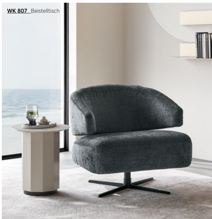
WK 807 Beistelltisch