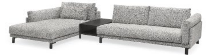
WK 590 LISBOA