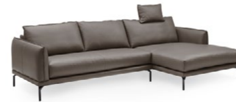
WK 594 OSLO