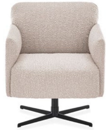
WK 593 GÖTEBORG Sessel.

Stoff Boucle PG 30, Fb. 19 greige mit bombierten Armlehnen und Rücken, B 65, T 74, H 72 cm, SH 39, ST 54 cm