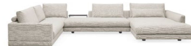
WK 592 MILANO

Fünf Serien – unzählige Möglichkeiten. Kombinieren Sie passende Bausteine zu einer Polster-Architektur ganz nach Ihrem Geschmack.