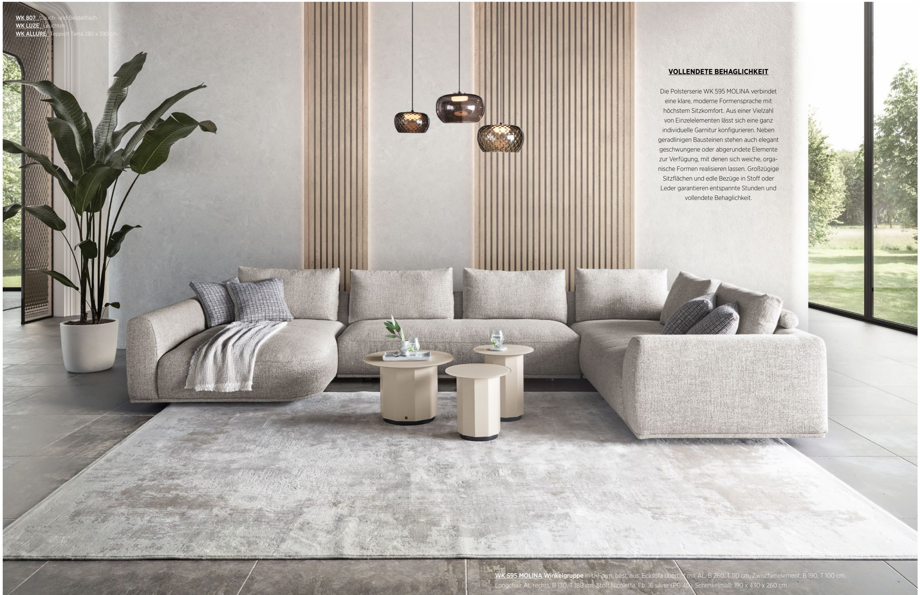
WK 595 MOLINA Winkelgruppe in U-Form, best. aus: Ecksofa übertief mit AL, B 260, T 110 cm, Zwischenelement, B 190, T 100 cm, Longchair AL rechts, B 130, T 180 cm, Stoff Nicoletta, Fb. 16 silver (PG 40), Schenkelmaß: 190 x 430 x 260 cm

Die Polsterserie WK 595 MOLINA verbindet eine klare, moderne Formensprache mit höchstem Sitzkomfort. Aus einer Vielzahl von Einzelementen lässt sich eine ganz individuelle Garnitur konfigurieren. Neben geradlinigen Bausteinen stehen auch elegant geschwungene oder abgerundete Elemente zur Verfügung, mit denen sich weiche, organische Formen realisieren lassen. Großzügige Sitzflächen und edle Bezüge in Stoff oder Leder garantieren entspannte Stunden und vollendete Behaglichkeit.