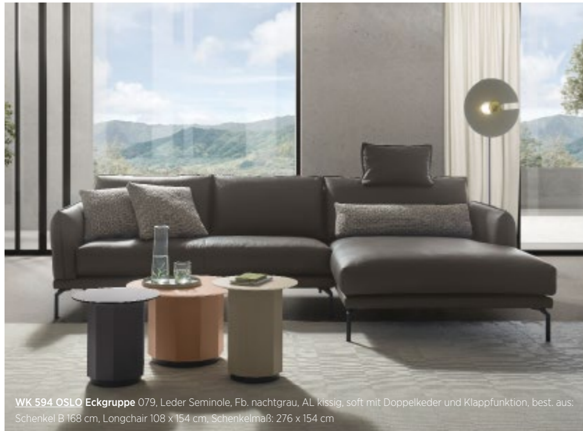
WK 594 OSLO Eckgruppe 079, Leder Seminole, Fb. nachtgrau, AL kissig, soft mit Doppelkeder und Klappfunktion, best. aus: Schenkel B 168 cm, Longchair 108 x 154 cm, Schenkelmaß: 276 x 154 cm

WK LIGNE PURE Teppich Dunas, 250 x 350 cm